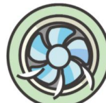
6. 調理場の 換気を徹底