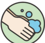
2. 手洗い 手の消毒を徹底