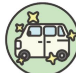
7. 配達車の 消毒を徹底