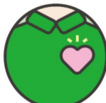
8. 従業員の 健康管理を徹底