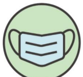
1. 従業員の マスク着用