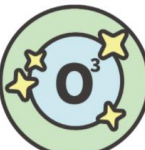
5. オゾンによる 水・空気の除菌