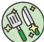
4. 調理器具の 消毒を徹底